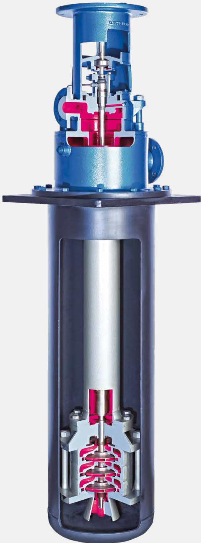
Mehrstufige Hochdruckpumpe als Topfpumpe: Q max. 400 m 3 /h, H max. 400 m